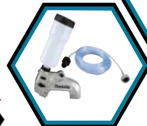
191X01-4 Wasserversorgung komplett mit Schlauch