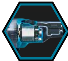
Bürstenloser, wartungsfreier und langlebiger Motor.

Geliefert mit 2x Akkus 4.0 Ah, Schnellladegerät, Schruppscheibe, Handriff, Nockenschlüssel und Makpac-D Transportkoffer