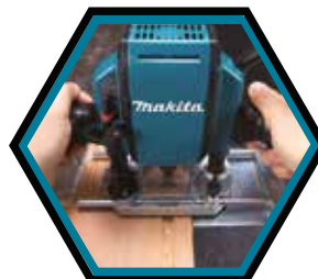
Gummiertes Griffsystem für komfortables Arbeiten.