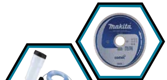
B-13091 Diamanttrennscheibe COMET 125 mm