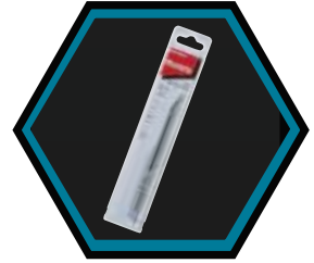
B-05153-25 25 HCS- Säbelsägeblätter SuperExpress für Holz

Geliefert mit 2x Akkus 4.0 Ah, Schnellladegerät, Set Säbelsägeblätter und Transportkoffer + 25 HCS- Säbelsägeblätter SuperExpress für Holz Art. B-05153-25